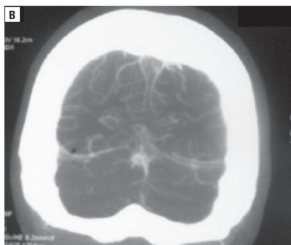
Rycina 1A, B. Zakrzepica żylna wewnątrzczaszkowa (angio-CT, 16.08.2010) (badania angio-CT wykonano w pracowniach Tomografii Komputerowej Szpitala Wojewódzkiego nr 2 w Rzeszowie i Szpitala MSWiA w Rzeszowie,)

Figure 1A, B. Cerebral vein thrombosis (angio-CT, 16/08/2010) (angio-CT studies performed in the Departments of Radiology — Computed Tomography of State Hospital No. 2 and Hospital of Internal Affairs and Administration in Rzeszów,)