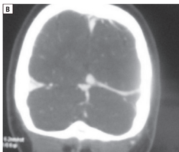
Rycina 2A, B. Zakrzepica żylna wewnątrzczaszkowa — badanie wykonane w trakcie leczenia (angio-CT, 30.08.2010)

Figure 2A, B. Cerebral vein thrombosis — a study carried out during treatment (angio-CT, 30/18/2010)