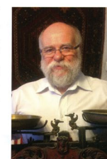
Krzysztof Marczewski © Marczewski

The pursuit of justice at the expense of efficiency is somewhat like the choice of equal sharing of misery instead of the unequal distribution of wealth. On the other hand a sense of justice is very strong and fulfils an important social function. The high costs of administration of justice, including the earnings of lawyers, are the indirect evidence. The simplest