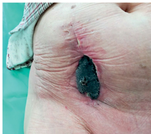
Rycina 2. Założona pianka poliuretanowa w ranie

nie tętnicze 176/86 mm Hg, a liczba oddechów 24/min. Na bloku operacyjnym w znieczuleniu ogólnym dokonano chirurgicznej rewizji rany z pobraniem wyskrobin na badanie mikrobiologiczne. Oczyszczono brzegi i dno rany z martwicy i ewakuowano niewielki ropień znajdujący się w tkankach podskórnych. Założono opatrunek podciśnieniowy typu VAC, którego siłę ssącą ustawiono na –125 mm Hg. Opatrunek ten utrzymywano w ranie przez 72 godziny, następnie usuwano, a ranę przemywano preparatem antyseptycznym i zakładano nowy opatrunek podciśnieniowy na kolejne 72 godziny (ryc. 1–4). W ciągu całego pobytu pacjentki w szpitalu dokonano pięciu zmian opatrunku podciśnieniowego — łącznie opatrunek stosowano przez 15 dni. Jednocześnie włączono antybiotykoterapię o szerokim