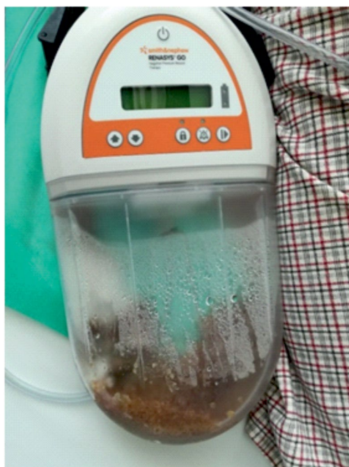
Rycina 4. Aparat do terapii podciśnieniowej rany (NPWT, negative pressure wound therapy )

spektrum działania, a następnie zmieniono na antybiotykoterapię celowaną zgodnie z wynikami badania mikrobiologicznego. W wyniku leczenia rany opatrunkiem typu VAC doszło do jej całkowitego oczyszczenia z martwicy i nadmiaru ropnego wysięku, a ranę zszyto na bloku operacyjnym w znieczuleniu ogólnym.