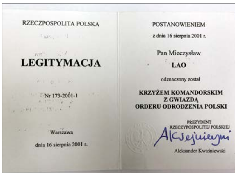
Rycina 8. Legitymacja odznaczenia Krzyżem Komandorskim z Gwiazdą Orderu Odrodzenia Polski z 2001 roku.

wielu konferencji naukowych w Polsce, między innymi „Postępy w immunosupresji narządów unaczynionych”. Już w 1960 roku odbywały się kursy obecnego CMKP na temat leczenia dializami. Był wielkim zwolennikiem wyprowadzania szkoleń i konferencji z ośrodków akademickich i organizowania ich w ośrodkach regionalnych. To dążenie, wsparte działaniami innych prominentnych nefrologów, sprawdziło się potem, kiedy organizowano konferencje naukowo-szkoleniowe PTN w ośrodkach pozaakademickich. Część z tych ośrodków zalicza się już do ośrodków uniwersyteckich (ryc. 6, 7).