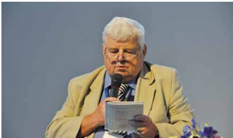
Rycina 1. Profesor Olgierd Smoleński podczas prowadzenia sesji na XI Zjeździe PTN we Wrocławiu w 2013 roku