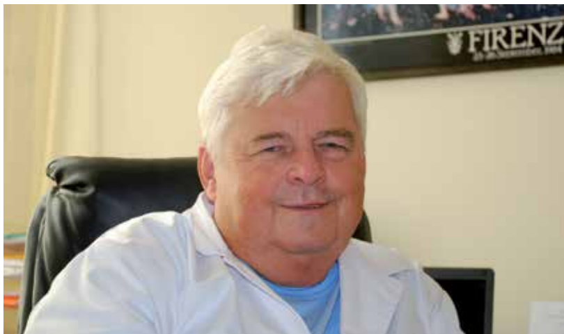
Rycina 2. Profesor Olgierd Smoleński w swoim gabinecie