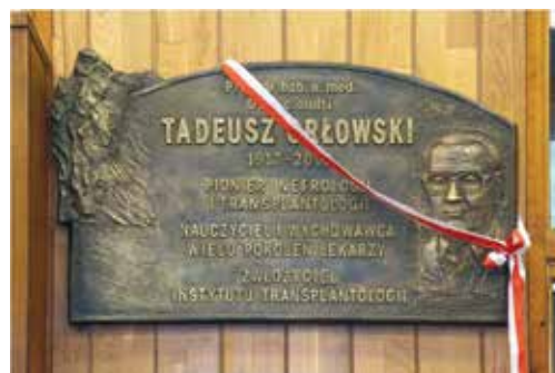
Rycina 4. Tablica pamiątkowa w Instytucie Transplantologii w Warszawie

PAN, przez wiele lat był także Przewodniczącym Rady Naukowej Instytutu Immunologii i Terapii Doświadczalnej PAN imienia Ludwika Hirszfelda we Wrocławiu.