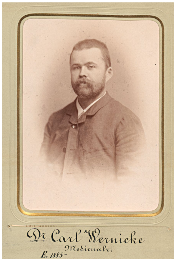
Rycina 4. Carl Wernicke (ok. 1885 r.)