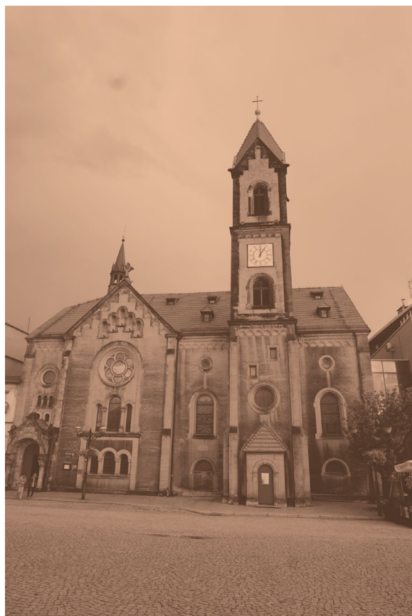
Rycina 2. Zabytkowy kościół ewangelicko-augsburski pod wezwaniem Zbawiciela w Tarnobrzegu