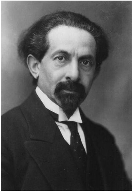
Rycina 1. Edward Flatau — twórca pierwszej polskiej szkoły neurologicznej

wstała pierwsza katedra neurologii, a więc jeszcze przed Charcotem (1882), a w 1875 roku utworzono pierwsze na świecie towarzystwo neurologiczne.