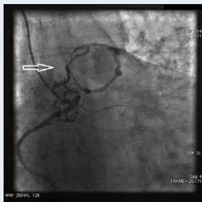
Rycina 1. Prawa tętnica wieńcowa, CAU 30. Widoczna przetoka łącząca proksymalny segment RCA z lewą tętnicą płucną (biała strzałka)