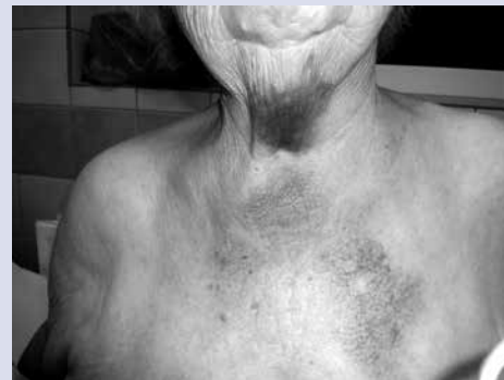
Rycina 3. Krwiak tkanek miękkich szyi