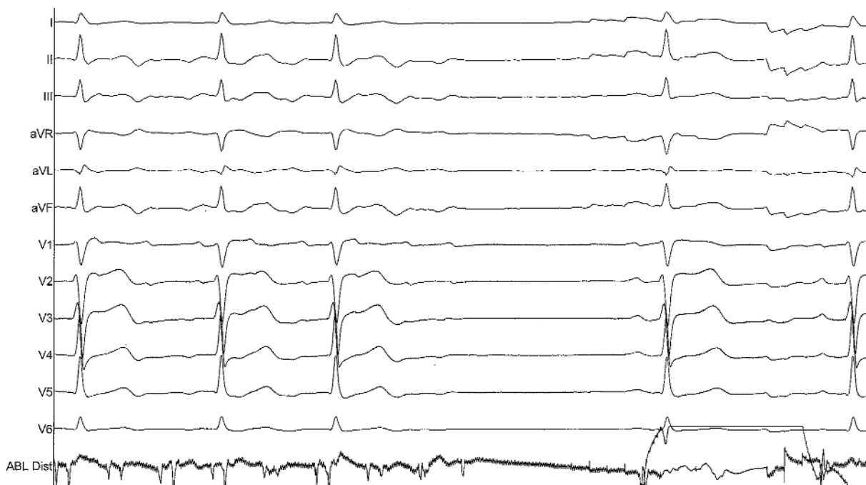
Rycina 2. Przerwanie trzepotania i powrót rytmu zatokowego podczas aplikacji RF. ABL dist – zapis z końcówki elektrody ablacynnej (przesuw 50 mm/s)

ablacyjną EZ Steer DS (Biosense Webster) z końcówką 8 mm, którą pozycjonowano w cieśni trzepotania przedsionków pod kontrolą RTG oraz zapisów wewnątrzsercowych, metodą opisaną przez Cosio i wsp. [6, 7]. Wykonano serię 15 aplikacji RF i uzyskano ustąpienie AFL i rytm zatokowy (Rycina 2.). Elektrode diagnostyczną z prawej komory przemieszczono do prawego przedsionka i stosując stymulację z jednoczesną analizą zapisów z elektrody „Halo”, wykazano blok przewodzenia w cieśni (Rycina 3.). Skuteczność zabiegu potwierdzono po 30 min od ostatniej aplikacji. W kolejnej dobie rejestrowano rytm zatokowy, pacjent został wypisany do domu z zaleceniem kontynuowania farmakoterapii. Podczas kontrolnej wizyty po 2 miesiącach od zabiegu potwierdzono rytm zatokowy w EKG i 24-godzinnym badaniu EKG metodą Holtera. Mężczyzna zgłaszał subiektywną poprawę – kołatania serca ustąpiły i poprawiła się wydolność wysiłkowa (obecnie I klasa wg NYHA). Planowane jest stopniowe odstawienie amiodaronu, a następnie warfaryny, jeśli utrzyma się stabilny rytm zatokowy.