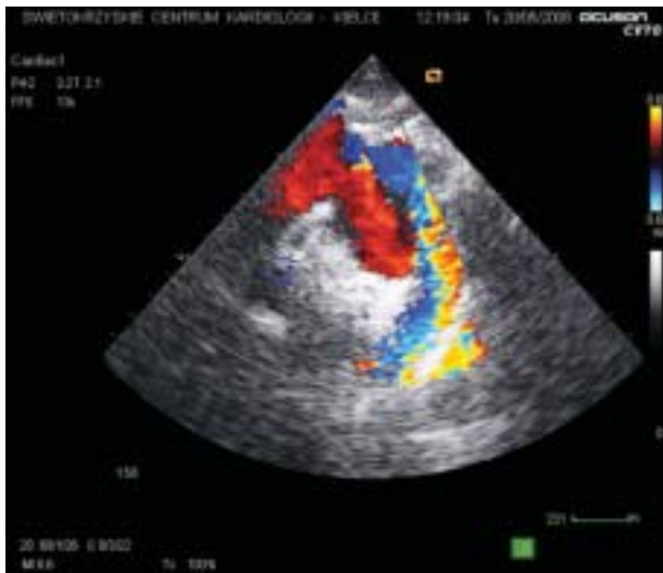
Rycina 4. Badanie echokardiograficzne przezklatkowe, projekcja nadmostkowa, badanie metodą kolorowego Dopplera: widoczny tętniak łuku aorty, podejrzenie izolowanego odwarstwienia błony wewnętrznej

go tętniaka łuku aorty o wymiarach 34 \times 43 \times 56 mm, na granicy odejścia tętnicy podobojczykowej lewej, przemieszczającego tchawicę.