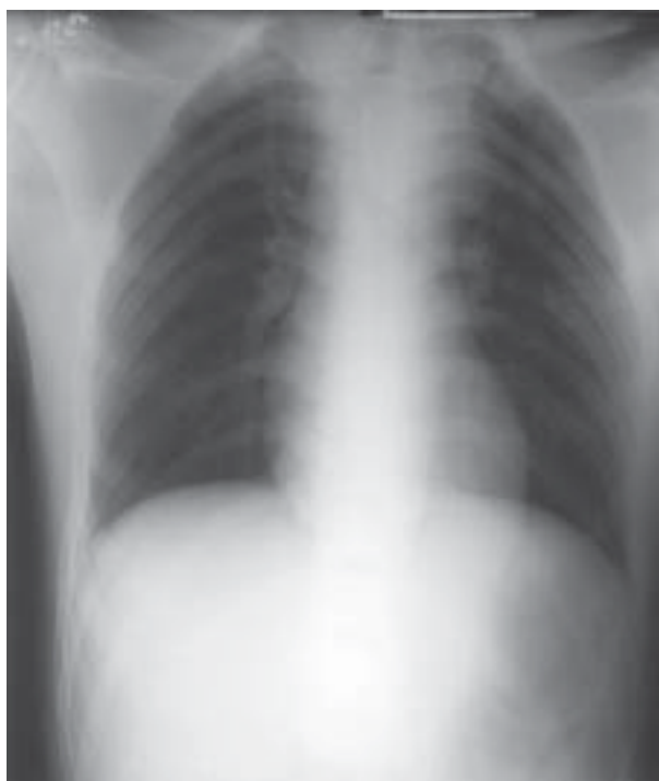
Rycina 2. Badanie RTG klatki piersiowej PA: poszerzony cień śródpiersia górnego po stronie lewej łączący się z łukiem aorty, z objawami ucisku na tchawicę nad poziomami kręgów Th2–Th3, płuca prawidłowo powietrzne. Nie stwierdzono odmy opłucnej, przepona wolna, sylwetka serca prawidłowa