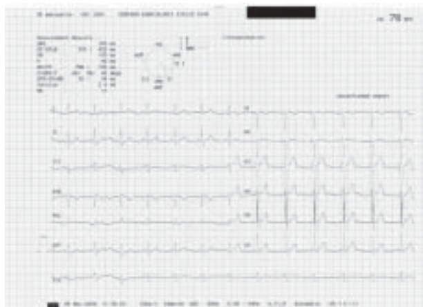
Rycina 1. Spoczynkowy zapis EKG przy przyjęciu: normogram, rytm zatokowy miarowy o częstości 78/min, zapis w granicach normy

w przypadku bezobjawowego przebiegu choroby [2]. W niniejszej pracy przedstawiono przypadek 29-letniego mężczyzny z pourazowym tętniakiem łuku aorty skutecznie leczonym operacyjnie w trybie odroczonej w 6. miesiącu od urazu.