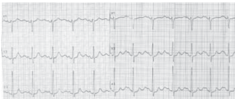
Rycina 2. Spoczynkowe EKG, odprowadzenia V1–V3. Po lewej stronie przed wlewem z adrenaliny, po prawej tuż po zakończeniu wlewu z adrenaliny. Uwagę zwraca wyraźny wzrost fali U. Przed podaniem adrenaliny stosunek amplitudy załamka T/U > 1, po zakończeniu wlewu adrenaliny stosunek załamka T/U < 1

Hisa (LBBB) z dodatnimi zespołami QRS w odprowadzeniach II, III i aVF, co sugerowało arytmie komorową pochodzącą z drogi odpływu prawej komory (RVOT). Z powodu nawracających epizodów nietrwałego częstoskurczu komorowego (NSVT) przeprowadzono badanie elektrofizjologiczne, w którym nie indukowano arytmii komorowej. Wykonano dwie sesje ablacji 3 ognisk arytmii w RVOT. Ablacja każdorazowo była skuteczna, ale krótkotrwała i po kilku miesiącach arytmia nawracała. Podczas kolejnego rutynowego badania kontrolnego w Poradni Kardiologicznej zwrócono uwagę, że w 24-godzinnym EKG występowały: arytmia komorowa wieloogniskowa, nasilająca się przy częstotliwości rytmu serca 100–130/min oraz epizody bezobjawowego NSVT o kształcie bloku prawej odnogi pęczka Hisa (RBBB); pary pobudzeń komorowych o przeciwstawnym kierunku; wydatna fala U w pobudzeniach komorowych przedwczesnych i w pobudzeniach poekstrasystolicznych (ryc. 1). Wysunięto podejrzenie CPVT. W trakcie próby wysiłkowej wystąpił bezobjawo-