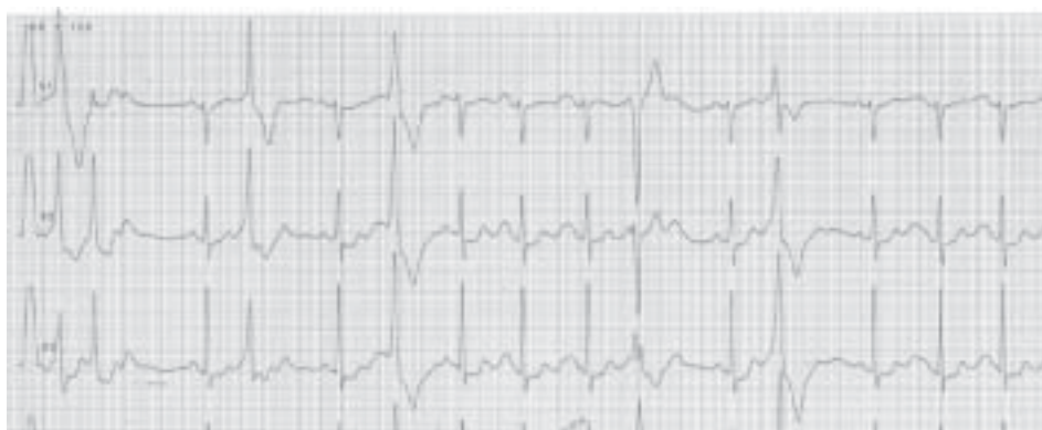
Rycina 1. Spoczynkowe EKG, fragment odprowadzenia V1–V3. Wlew z adrenaliny. Uwagę zwraca wydatna fala U w przedwczesnych pobudzeniach komorowych, inicjowanie pobudzeń komorowych na szczycie fali U, rzekomo ogromne P wskutek nakładania się wydatnej fali U na załamek P