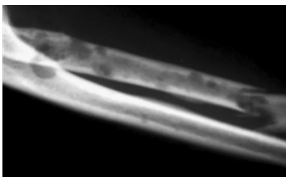
Rycina 2. Złamanie patologiczne prawej kości promieniowej (pacjentka 6)

a u kolejnych 20–30% ona się rozwinie. Na skutek osteolizy u pacjentów ze szpiczakiem często stwierdza się nieprawidłowe wartości wapnia w surowicy, a hiperkalcemia w obrazie choroby nowotworowej może zostać niedostrzeżona. Niedokrwistość i związane z nią osłabienie są obecnie u prawie wszystkich chorych. Lekarze w opiece paliatywnej mogą spotkać się także z krwawieniami wynikającymi z zespołu nadlepkkości.