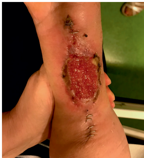
Rycina 2. Powikłania w gojeniu się rany u chorego napromienianego przedoperacyjnie.

Radioterapia pooperacyjna wiąże się z korzyścią w postaci uniknięcia komplikacji gojenia się rany, a także nieopóźniania wykonania operacji o okres napromieniania i przerwy do zabiegu. W przypadku radioterapii pooperacyjnej jest wymagana fuzja tomografii komputerowej do planowania radioterapii z badaniem obrazowym przed operacją. Możliwe jest wykorzystanie nowoczesnych technik fuzji elastycznej w celu lepszego odwzorowania położenia guza w pooperacyjnych warunkach anatomicznych. Objętość guza pierwotnego (CTVg, preoperative gross tumor volume as clinical target volume ) stanowi guz widoczny w badaniach przedoperacyjnych oraz łoża po jego resekcji. Objętość tarczową elektywną wysokiego ryzyka (CTVh, high risk clinical target volume ) wyznacza się, dodając 1,0–1,5-centymetrowy margines tkanek zdrowych wokół guza. Objętość tarczową elektywną pośredniego ryzyka (CTVm, intermediate risk clinical target volume ) konturuje się podobnie jak w radioterapii przedoperacyjnej, dodając 1,5–2,0 cm wokół CTVg z uwzględnieniem naturalnych barier anatomicznych (np. kości, powięzie) i dodatkowo w wymiarze podłużnym do 4 cm od biegunów CTVg w przypadku mięsaków zlokalizowanych na kończynach. Do każdej z tarczowych objętości elektywnych (CTVh, CTVm) jest dodawany margines błędu 0,5–1,0 cm. Konwencjonalny schemat frakcjonowania zakłada podanie 50 Gy we frakcjach po 2 Gy na objętość pośredniego