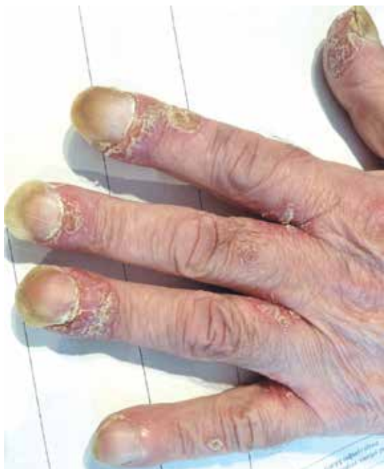
Rycina 5. Zapalenie wałów paznokciowych w stopniu 2. wg Common Terminology Criteria for Adverse Events v. 4.0 u chorego podczas terapii inhibitorem EGFR. W badaniu mikologicznym wykluczono zakażenie drożdżakowe i grzybicze