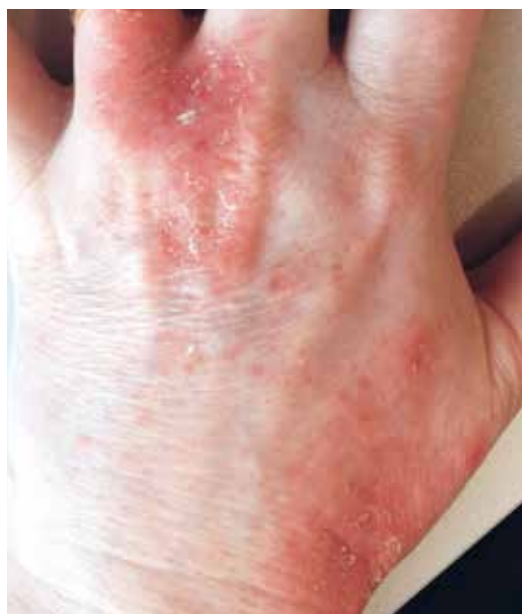
Rycina 7. Wyprysk kontaktowy z podrażnienia u pacjentki podczas terapii afatynibem, która intensywnie moczyła ręce w okresie letnim, przygotowując weki na zimę. Zastosowanie kolejnych glikokortykosteroidów o działaniu miejscowym bez natłuszczenia skóry i ograniczenie kontaktu z wodą nie przyniosłoby poprawy leczniczej. Skóra podczas terapii anti-EGFR staje się bardzo wrażliwa i wolniej regeneruje

Z zasady do natłuszczenia skóry lepiej stosować preparaty specjalistyczne i dermokosmetyki, które odbudowują i regenerują płaszcz lipidowy i z zasady pozbawione są działania zatykającego (okluzyjnego), które nasila występowanie zmian trądzikowych. Specjalistyczne preparaty emolientowe najlepiej nabyć w aptece. W przypadku pękającej skóry warto zasto-