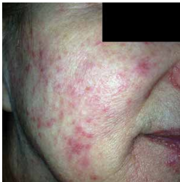
Rycina 1. Zapalne zmiany grudkowe trądzikopodobne na twarzy pacjentki w trakcie terapii inhibitorem EGFR

Zahamowanie aktywności błonowego receptora EGF zaburza dojrzewanie i różnicowanie podstawowych komórek budulcowych naskórka i nabłonka, keratynocytów, hamuje ich wzrost i migrację oraz aktywuje chemokiny prozapalne [3]. Upośledzone dojrzewanie i rogowacenie keratynocytów, szczególnie skomplikowanie wyrażone w wyspecjalizowanej strukturze, jaką stanowi mieszek włosowy połączony z gruczołem łojowym, indukuje stan zapalny, który dodatkowo aktywowany chemokinami (m.in. CCL18, XCL1), silnie przyciąga komórki zapalne wrodzonej odpowiedzi immunologicznej, to jest neutrofile i komórki natural killers (NK). Komórki zapalne nasilają procesy destrukcyjne w tkance, do której zostały przyciągnięte z krążącej krwi przez chemokiny, i tym bardziej dochodzi do uszkodzenia skóry, upośledzenia jej funkcji i zmian zapalnych o typie grudek i ropnych krostek. Najczęstszym skórny działaniem niepożądanym terapii anty-EGFR jest osut-