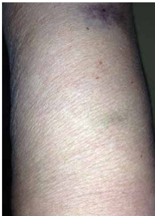
Rycina 6. Skóra z wyraźnymi objawami wysuszenia u 60-letniej pacjentki otrzymującej terapię inhibitorem EGFR