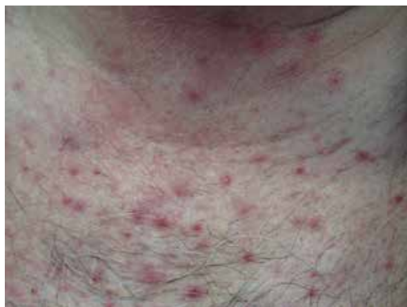
Rycina 3. Zmiany grudkowo-krostkowe na dekolcie u chorego podczas terapii inhibitorem EGFR. Tego typu zmiany często swędzą lub bołą

W związku z tym, że osutka trądzikopodobna stanowi nierozdzielny element terapii anti-EGFR, występujący u ponad 70% pacjentów, w różnym stopniu nasilenia, w publikacjach z ostatnich lat panuje zgoda, że leczenie profilaktyczne, zapobiegające jej powstawaniu, powinno być stosowane od pierwszego dnia terapii u wszystkich chorych. Prewencyjne postępowanie skutecznie redukuje stopień nasilenia toksyczności skórnej i zmian trądzikopodobnych, co pozwala utrzymać terapeutyczną dawkę leku i niezbędny czas trwania terapii. A to ma istotny wpływ na skuteczność leczenia onkologicznego [5].