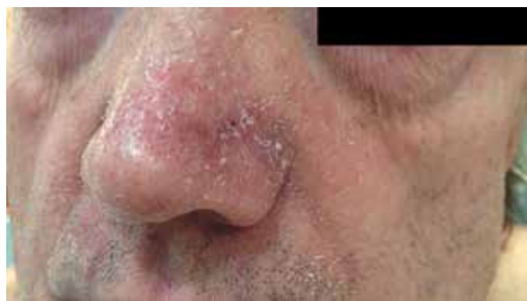
Rycina 2. Zmiany zapalne grudkowe na nosie u pacjenta otrzymującego afatynib przykryte łuskami suchej i napiętej skóry. Etiopatogeneza zmian zapalnych trądzikopodobnych podczas terapii inhibitorami EGFR jest odmienna niż w klasycznym trądziku