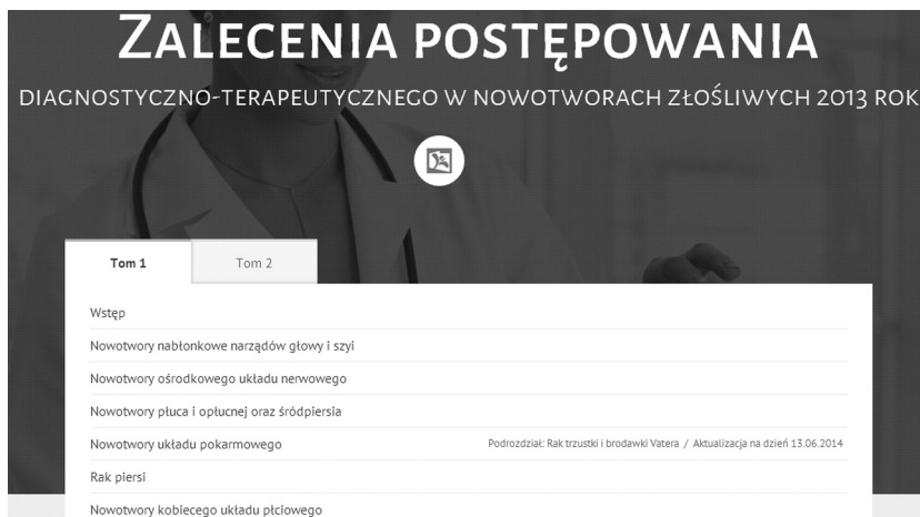
Rycina 1. Fragment strony zawierającej elektroniczną wersję książki „Zalecenia postępowania...”, opracowanej pod auspicjami PTOK

Strona zawierająca zalecenia PTOK nie została sformatowana z myślą o urządzeniach mobilnych, takich jak smartfony lub tablety, niemniej jednak wyświetlenie i nawigacja po