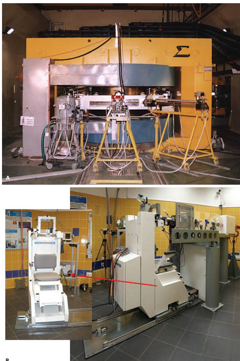
Rycina 2. Cyklotron AIC-144 (A) i stanowisko radioterapii protonowej (B) nowotworów narządu wzroku uruchomione w 2011 roku

frakcjonowania dawki [2], natomiast częstość powikłań była mniejsza w przypadku stosowania skróconych schematów frakcjonowania dawki [2, 31].