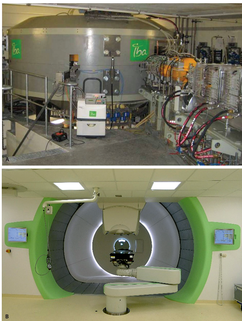
Rycina 3. Cyklotron Proteus-235 (A), który został zamontowany w 2012 roku i stanowisko terapeutyczne (B), które obecnie zostało zainstalowane