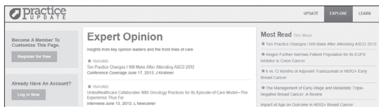
Rycina 1. Fragment strony głównej serwisu PracticeUpdate z widocznymi polami rejestracji i logowania

Po dokonaniu rejestracji (lub po zalogowaniu się) w obrębie sekcji ustawień („My Profile & Settings”) można zamówić darmową prenumeratę elektronicznych biuletynów o różnej formule i zawartości, ukazujących się z odmienną częstotliwością. Na rycinie 2 przedstawiono dostępne biuletyny: „Daily Digest” ukazuje się cztery razy w tygodniu