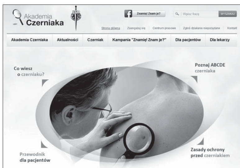
Rycina 1. Strona główna serwisu Akademia Czerniaka (sekcji naukowej Polskiego Towarzystwa Chirurgii Onkologicznej)

W następnej zakładce widocznej na głównej belce („Czerniak”) oraz w zakładce „Dla pacjentów” zamieszczono podstawowe informacje o charakterze edukacyjnym (np. dane epidemiologiczne odnoszące się do czerniaka w naszym kraju, system ABCDE służący do prostej oceny znamion skórnych, elementarne zasady ochrony skóry przed szkodliwym wpływem promieniowania słonecznego, odpowiedzi na pytania często zadawane przez pacjentów itp.). Materiały dostępne w tej części strony internetowej Akademii Czerniaka przygotowano w przejrzysty i przystępny sposób, co czyni je wartościowym źródłem informacji zrozumiałych także dla nielekarzy. Dodatkowo w omawianych częściach serwisu można odnaleźć listę polskich ośrodków zajmujących się w sposób kompleksowy diagnostyką i leczeniem czerniaka (zarówno ośrodki dermatologiczne,