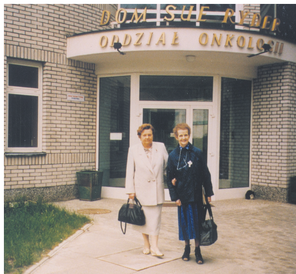
Ryc. 3. Sue Ryder przed nowym budynkiem Oddziału Onkologii w Gdyni-Redłowie w towarzystwie autorki artykułu (1996 r.)

Fundamenty zaczęto budować jesienią 1990 r., a wmurowanie kamienia węgielnego odbyło się 6 grudnia 1990 r.