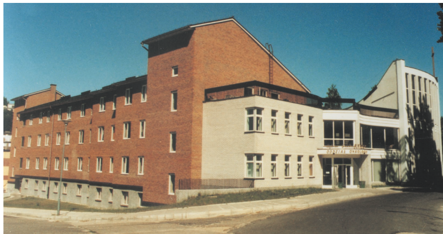
Ryc. 2. Nowy kompleks onkologiczny Fundacji Sue Ryder w Gdyni-Redłowie

w maju 1991 r. Była to ostatnia podróż Leonarda Cheshire, w tym też roku poważnie zachorował. Zmarł 31 lipca 1992 r.