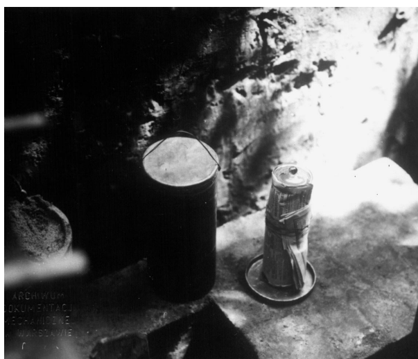
Ryc. 4. Metalowa puszka z aktem erekcyjnym przygotowana do zamurowania

7 czerwca – Przyjęcie w Ratuszu, godz. 10.30. Osiem przemówień: 1. p. Wojciech Trąmpczyński – Marszałek Sena-