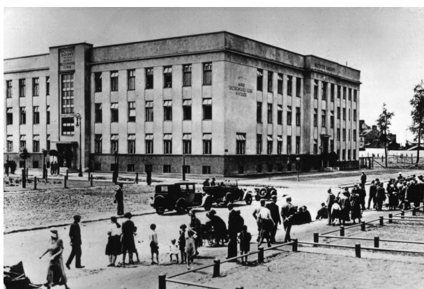
Ryc. 6. Instytut Radowy wkrótce po otwarciu

12 czerwca – powrót do Warszawy. Godz. 16.00 – przyjęcia, godz. 17.00 – przyjęcie Komitetu Daru Narodowego i Marszałka Piłsudskiego.