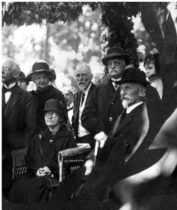
Ryc. 2. Uroczystość położenia kamienia węgielnego pod budowę Instytutu Radowego 6 czerwca 1925 roku. Obok Marii Skłodowskiej-Curie siedzi Prezydent Stanisław Wojciechowski

Zachowała się rękopiśmienna notatka sporządzona w języku francuskim przez Marię Skłodowską-Curie. (Arch. Muz. MSC, Warszawa, M/89), a przedstawiająca program jej pobytu w Warszawie w 1925 r.: