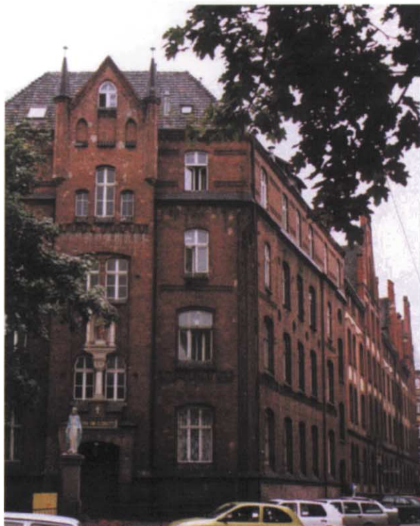
Katedra i Klinika Onkologii AM im. Karola Marcinkowskiego w Poznaniu