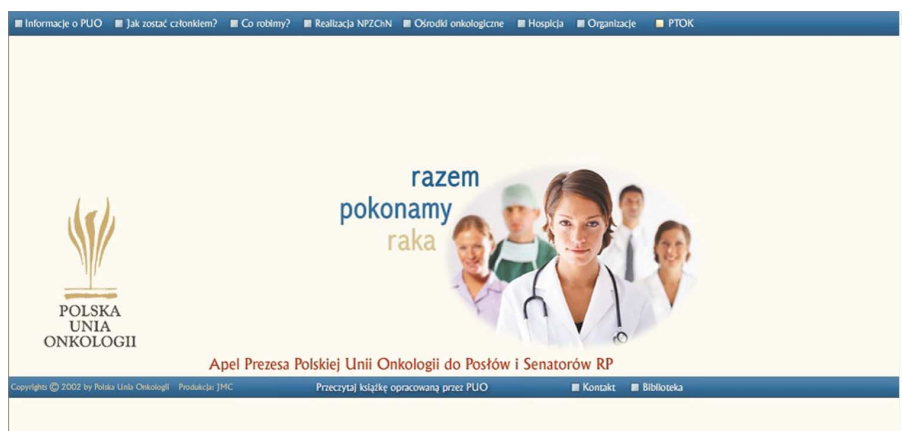
Ryc. 2. Główna strona WWW Polskiej Unii Onkologii; na dolnym pasku widoczny jest odsyłacz do podręcznika Zalecenia postępowania diagnostyczno-terapeutycznego w nowotworach złośliwych u dorosłych

otworzyć i wydrukować deklarację woli przystąpienia do tej organizacji („Jak zostać członkiem?”). Niestety, jak dotąd nie jest możliwe zgłoszenie takiej deklaracji wyłącznie za pomocą komputera i Internetu (tj. online ); niezbędnym elementem procedury uzyskiwania członkostwa jest skorzystanie z tradycyjnej poczty. Można oczekiwać, że rozwiązanie umożliwiające przystąpienie do PUO bez konieczności odchodzenia od komputera pojawi się w niedalekiej przyszłości, bowiem taka możliwość jest dostępna w przypadku wielu zagranicznych lekarskich stowarzyszeń naukowych. Kolejne pozycje menu strony głównej Polskiej Unii Onkologii prowadzą do informacji dotyczących jej aktualnej działalności („Co robimy?”), wiadomości na temat Narodowego Programu Zwalczenia Chorób Nowotworowych („Realizacja NPZChN”), danych teled adresowych większości działających w Polsce hospicjów („Hospicja”) oraz ośrodków onkologicznych („Ośrodki onkologiczne”). Niestety, z żalem trzeba zauważyć, że w spisie ośrodków onkologicznych nie znalazło się miejsce dla adresów stron WWW tych, które takie strony posiadają. Obecnie, gdy Internet jest jednym z najczęściej wykorzystywanych źródeł informacji, brak tego typu danych wymaga pilnego uzupełnienia.