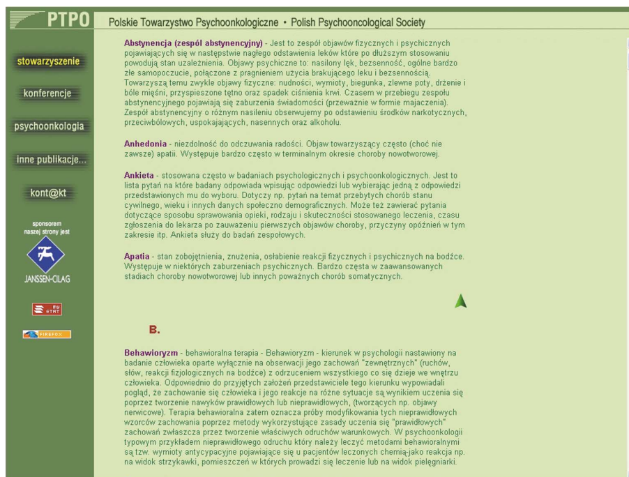
Ryc. 5. Słowniczek psychoonkologiczny na stronie WWW Polskiego Towarzystwa Psychoonkologicznego

szukać w Internecie stron WWW Polskiego Towarzystwa Ginekologii Onkologicznej, Polskiego Towarzystwa Hematologów i Transfuzjologów oraz Polskiego Towarzystwa Hematologii i Onkologii Dziecięcej.