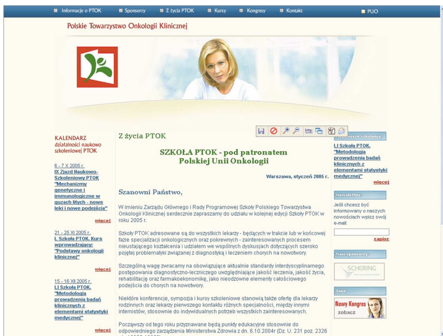
Ryc. 4. Główna strona WWW Polskiego Towarzystwa Onkologii Klinicznej