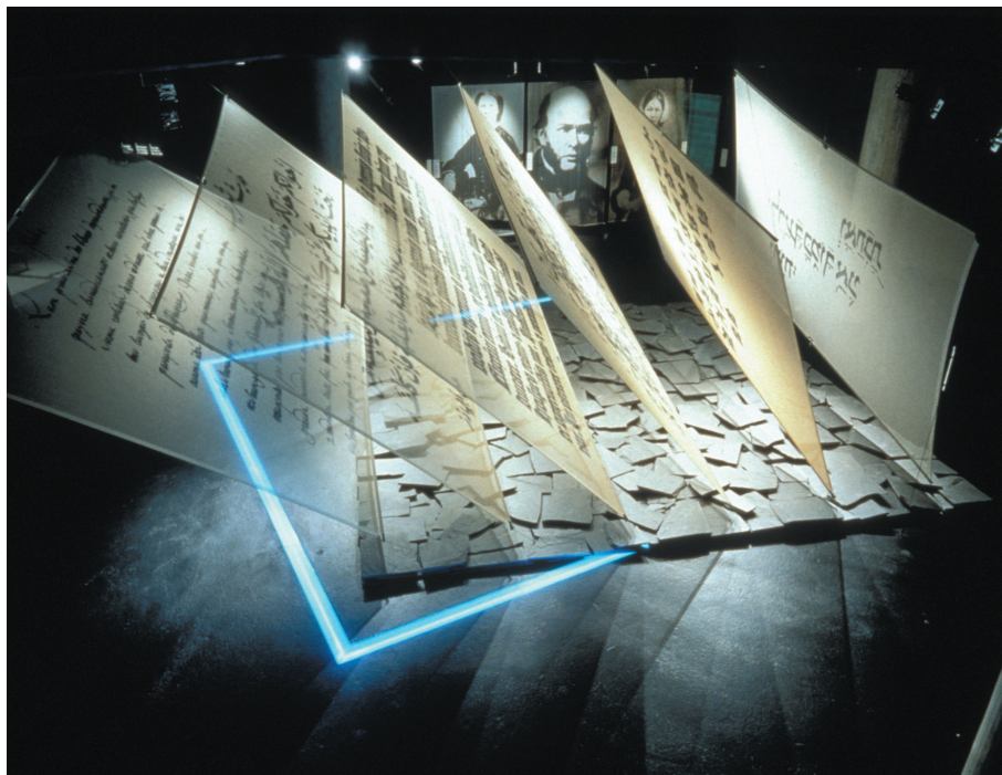
Ryc. 2. Pierwsza sala Muzeum z wyeksponowanymi sześcioma tekstami, pochodzącymi z różnych wieków i cywilizacji, pisanymi różnym pismem, ale niosącymi ten sam przekaz: szacunek i miłość są w stanie zwyciężyć przemoc i nienawiść

towej oraz dokumentacją dotyczącą 2 milionów jeńców i więźniów z tego okresu. Dopiero w 1949 roku uchwalono konwencje dotyczące traktowania jeńców wojennych (III Konwencja Genewska) i ochrony cywilów (IV Konwencja Genewska). Wobec powyższego Czerwony Krzyż