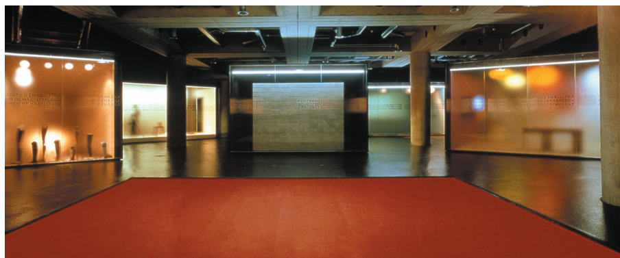
Ryc. 5. Jedna z sal Muzeum ukazująca współcześnie prowadzone przez Czerwony Krzyż działania, np. pomoc ofiarom min lądowych