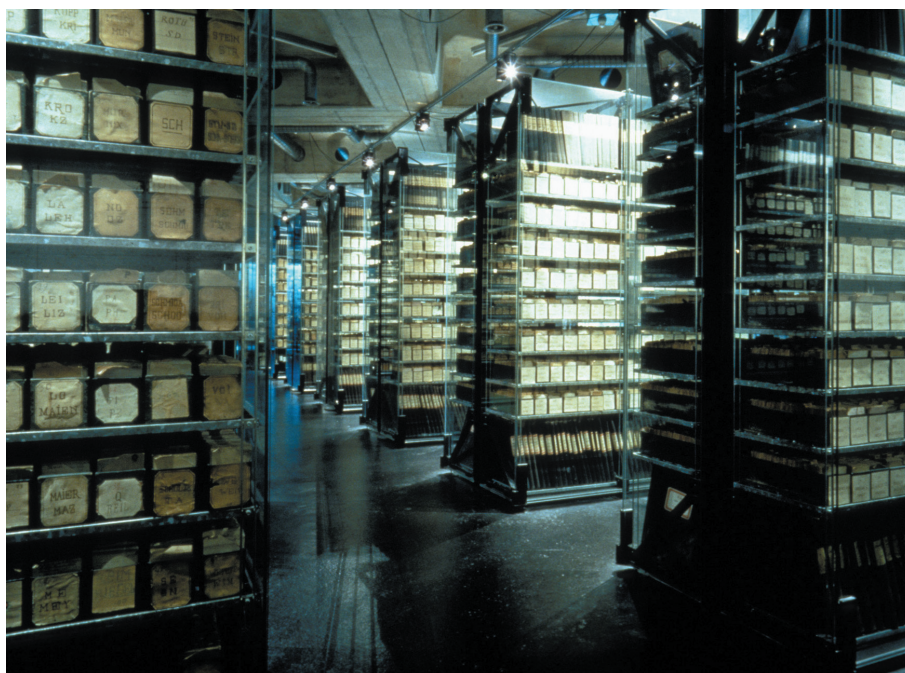
Ryc. 4. Regaly z kartami ewidencyjnymi żołnierzy i jeńców I wojny światowej (pochodzących z 38 zwaśnionych państw)

moc w ratowaniu ludzi, którzy ucierpieli w wyniku klęsk żywiołowych i epidemii, pomoc chorym na AIDS, bezdomnym, ofiarom min, pomoc i walka o prawa więźniów i jeńców, akcje odnajdywania zaginionych i łączenia rodzin, szkolenie w zakresie pierwszej pomocy.