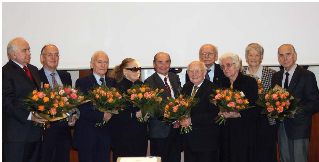
Członkowie Honorowi Oddziału Warszawskiego Polskiego Towarzystwa Onkologicznego