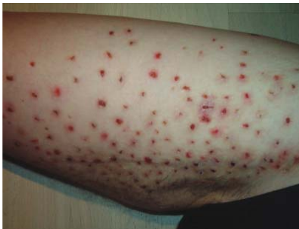
Ryc. 1. Wysypka i owrzodzenia pachwiny