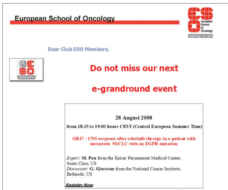
Ryc. 5. Fragment listu elektronicznego zawiadamiającego członka Club-ESO o nadchodzącym wykładzie w ramach projektu „E-grandrounds”

szenie chęci uczestnictwa w internetowym wykładzie. Na Rycinie 5. przedstawiono fragment przykładowego listu elektronicznego, z zawiadomieniem o tematyce najbliższego wykładu „E-grandrounds”.