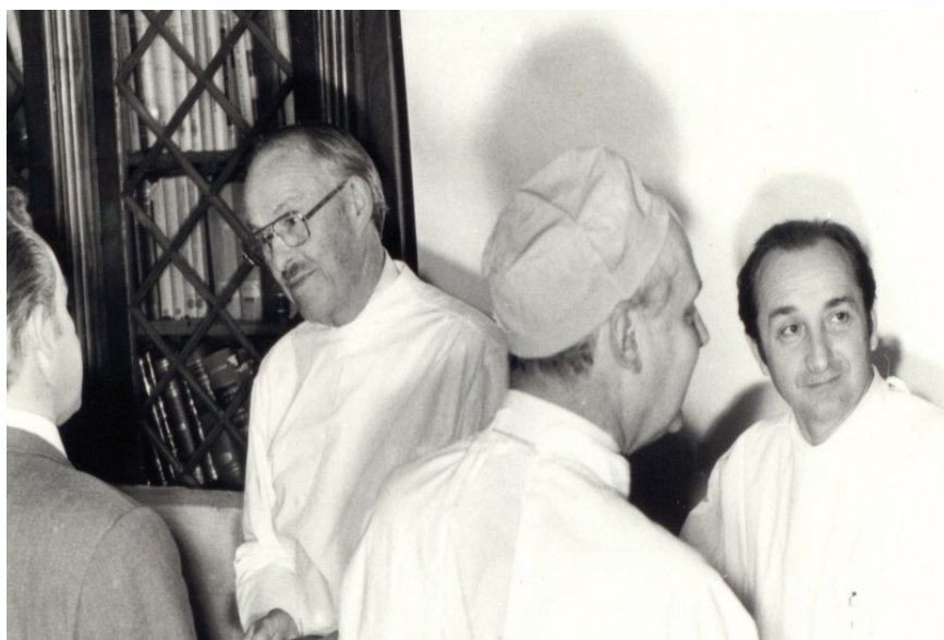
Ryc. 3. Wizyta Randolpha Lee Clarka Jr. w Instytucie Onkologii w Warszawie (1975 r.)

W latach 1972–1976, w ramach umowy polsko-amerykańskiej, prowadziliśmy prace dotyczące rehabilitacji kobiet po leczeniu raka piersi. Program wzorowany był na amerykańskim „Reach to Recovery”. W 1980 r. wniosek wdrożeniowy „Metody rehabilitacji kobiet po mastektomii”, opracowany przez A. Kułakowskiego i Krystynę Mikę, wprowadzono do wszystkich placówek sieci onkologicznej w kraju. W 1988 r. Minister Zdrowia przyznał