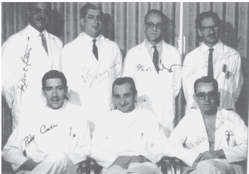
Ryc. 1. Zespół H&N(B) – RPMI w Buffalo (1965 r.)