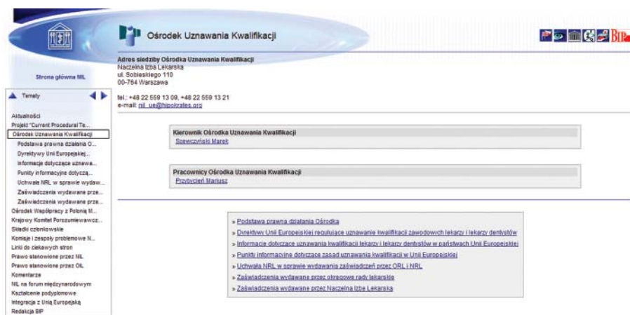
Ryc. 2. Fragment informacji dotyczących uznawania kwalifikacji zawodowych lekarzy w innych krajach członkowskich Unii Europejskiej

Spoglądając od lewej strony pierwsza pozycja menu to „Aktualności”. Siłą rzeczy zawartość tego menu częściowo pokrywa się z zawartością strony głównej. Dodatkowo umieszczono tam inne informacje – między innymi dokumenty odnoszące się do przepływu pracowników pomiędzy krajami Unii Europejskiej (w szczególności lekarzy; odsyłacz „Integracja europejska” w menu „Aktualności” oraz odsyłacz „Ośrodek uznawania kwalifikacji” w menu „Działalność”). W tej części znajduje się wiele informacji ważnych dla lekarzy pragnących podjąć pracę w innym kraju członkowskim Wspólnoty Europejskiej. Fragment części serwisu internetowego Naczelnej Izby Lekarskiej dotyczący tego zagadnienia przedstawiono na Rycinie 2.