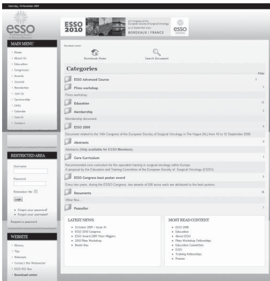
Ryc. 3. Zawartość części serwisu z plikami przeznaczonymi do pobrania („Download center”)

w przeszłości biuletynów (odsylacz „Newsletter”). Dzięki temu można uniknąć konieczności przechowywania ich w swojej skrzynce pocztowej, bowiem są one zawsze dostępne w elektronicznym archiwum na stronach ESSO. Zainteresowane osoby, które obecnie nie są subskrybentami biuletynu, mogą za pośrednictwem nowego serwisu