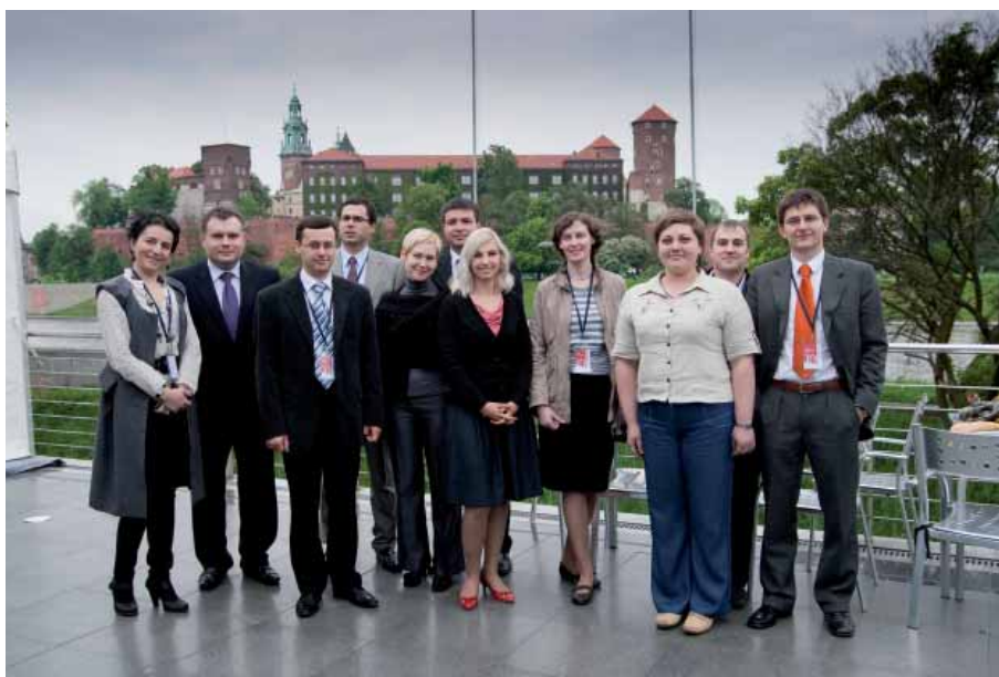
Stypendyści Fryderyk Teodor Oehme Travel Grant wraz z przedstawicielami fundatorów i organizatorów