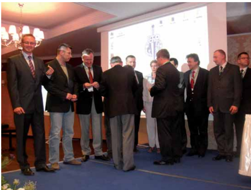
Wręczenie znaczków Towarzystwa nowo przyjętym członkom PTChO