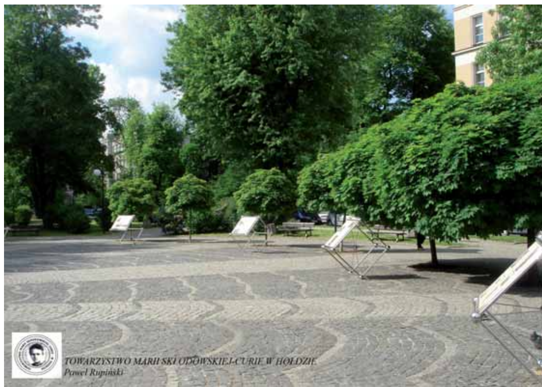
Ścieżka Edukacyjna Marii Skłodowskiej-Curie w parku przy ul. Wawelskiej w Warszawie

W dniu 26 maja 2011 r. na skwerze przy ul. Marii Skłodowskiej-Curie przed historyczną siedzibą Instytutu Radowego otwarto Ścieżkę Edukacyjną. Składa się z pięciu elementów małej architektury, zawierających fotografie, dokumenty oraz informacje o życiu, działalności