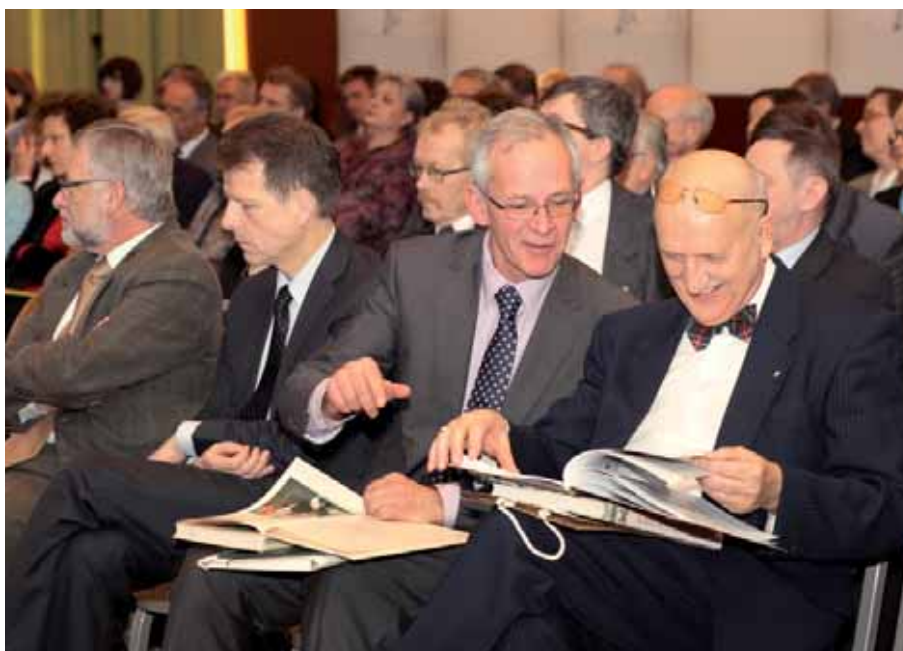
JM Rektor i Dyrektor przeglądają wzajemnie ofiarowane publikacje – Oficyny Wydawniczej Warszawskiego Uniwersytetu Medycznego i Redakcji Naukowej Centrum Onkologii

Zarządów Głównych: Polskiego Towarzystwa Chirurgii Onkologicznej i Polskiego Towarzystwa do Badań nad Rakiem Piersi.