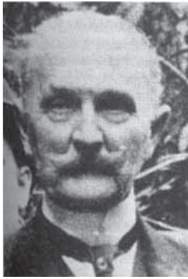
Prof. Franciszek Giedroyc – historyk medycyny

Franciszek Dowmont Giedroyc , urodzony na Żmudzi jeszcze przed powstaniem styczniowym, potomek starej kniaziowskiej rodziny, dyplom lekarza uzyskał w 1884 r. w Wilnie, ordynator Szpitala św. Łazarza w Warszawie, ale przede wszystkim znakomity historyk medycyny, autor podstawowych prac, m.in. blisko 1000-stronicowych Źródeł biograficzno-bibliograficznych do dziejów medycyny w Polsce , gdzie podał informacje o ponad 1200 lekarzach (o 800 jako pierwszy), poczynając od XII wieku. Opublikował też m.in. monografie: Rada Lekarska Księstwa Warszawskiego i Królestwa Polskiego (ponad 750 stron), Służba zdrowia w dawnym wojsku polskim (ok. 550 stron) i dwutomowy Polski Słownik Lekarski . Zmarł podczas powstania warszawskiego.