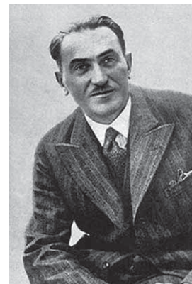
Dr Tadeusz Boy-Żeleński – inicjator akcji „Kropla Mleka” dla niemowląt, pisarz, tłumacz, satyryk