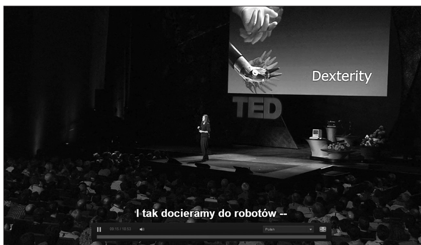
Rycina 3. Wykład o przyszłości chirurgii, dostępny z napisami w języku polskim, w wersji pełnoekranowej