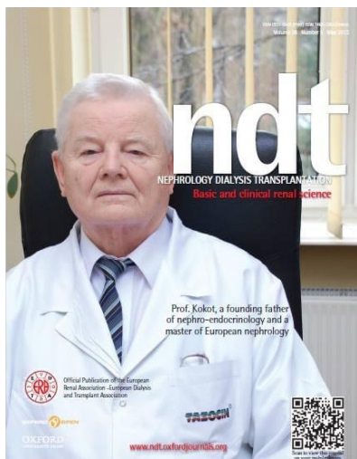
Profesor Franciszek Kokot na okładce prestiżowego czasopisma nefrologicznego Nephrology Dialysis Transplantation [ Nephrol Dial Transplant. 2013; 28(5)].

medycynę”. Profesor Kokot uważał, że ta rozmowa stanowiła decydującą chwilę w jego życiu.