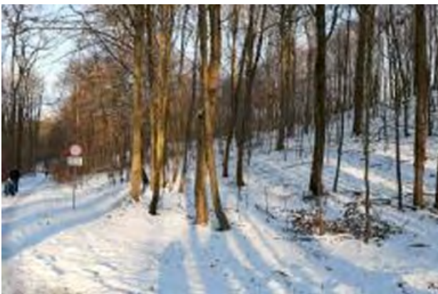
Śnieg w Puszczy Bukowej zalega średnio przez 40–48 dni

Obszar Puszczy Bukowej zamieszkiwany był już od około 8–10 tysięcy lat p.n.e. Było to jednak osadnictwo sporadyczne i rozproszone. Dopiero około 1000–1200 lat p.n.e. przybrało ono stały zorganizowany charakter. We wczesnym Średniowieczu teren ten zasiedliły plemiona Słowian, budując warowne grodziska, których pozostałości widoczne są do dziś. Zdecydowany przełom w historii Puszczy spowodowa-