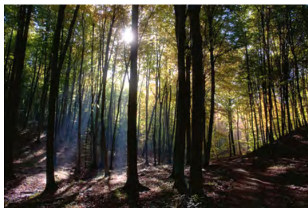
Tutejsze warunki klimatyczne i glebowe przede wszystkim doskonale odpowiadają zapotrzebowaniu buka

Wody zasiedla stale bądź okresowo co najmniej 29 gatunków ryb, z czego pod ochroną znajduje się takie jak piskorz ( Misgurnus fossilis ) i koza ( Cobitis taenia ). Oba gatunki stwierdzono w Płoni, a obecność kozy także w jeziorach: Binowskim i Glinna.