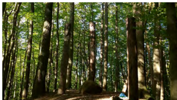
Charakterystycznym śladem pozostawionym przez lądolód są liczne głązy narzutowe

Charakterystycznym śladem pozostawionym przez lądolód są liczne głązy narzutowe. Obecnie z terenu Parku i jego otuliny znanych jest około 70 głązów o obwodzie przekraczającym 700 cm i ponad 800 o obwodzie od 400 do 700 cm. Sądząc po ilości brukowanych dróg, jakie z nich zbudowano, które do dziś pozostają w Puszczy, można przypuszczać, że kiedyś było ich dużo więcej.