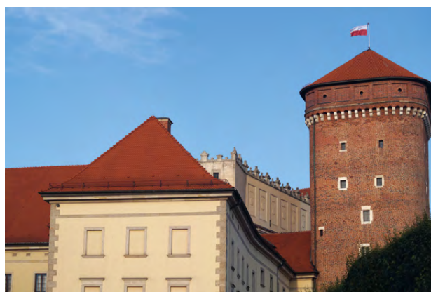
Rozbudowa miasta wokół wzgórza Wawelskiego jeszcze bardziej podkreślała znaczenie zamku

Okres niezwykłego prosperity przełomu XV–XVI wieku pozwolił także między innymi dzięki znacznej liczbie włoskich architektów przybyłych do Krakowa