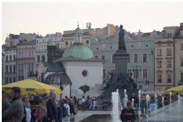
Rynek Główny — największy średniowieczny plac Europy