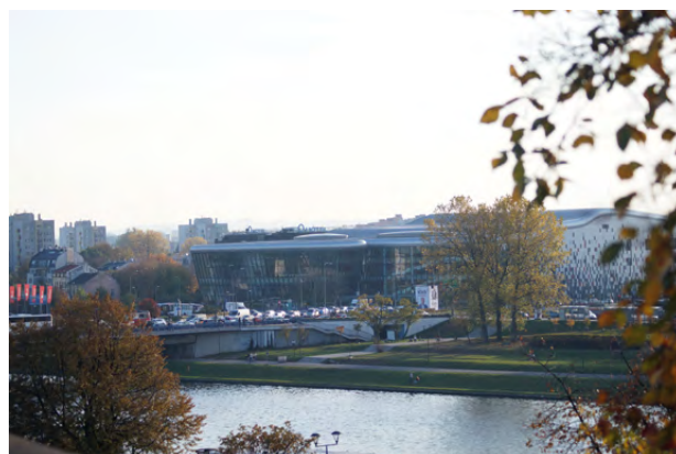
Niewiele miejsc w Europie może poszczycić się tak dużą liczbą zrealizowanych w ostatnich latach potrzebnych i znakomicie przygotowanych inwestycji

Co ciekawe, w gronie najwybitniejszych autorytetów zajmujących się historią Małopolski do dziś toczy się gorący spór o interpretację zapisanej w „Żywocie Świętego Metodego” informacji o „pogańskim księciu siedzącym na Wiśle”. Są wśród nich tacy, którzy „Wisłę” traktowaną jako naczelny gród państwa Wiślan, umiejscawiają w Wiślicy. Większość jednak opowiada się za Krakowem, co potwierdzałyby dane archeologiczne.