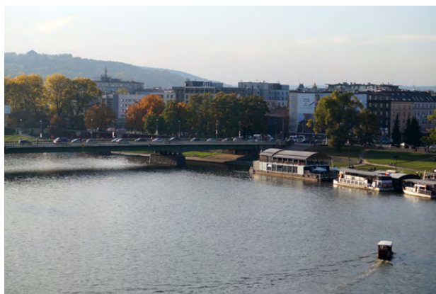
Kraków stał się stolicą Państwa Wiślan ze względu na bardzo sprzyjające warunki ukształtowania terenu i bliskość dużej rzeki

Innym tragicznym i symbolicznym wydarzeniem średniowiecznej historii Krakowa było zamordowanie biskupa krakowskiego Stanisława w kościele na Skałce, podczas sprawowania mszy świętej. Przypisywano je królowi Bolesławowi Szczodremu, a miało być konsekwencją poważnego konfliktu, jaki wybuchł między obydwoma dostojnikami. Ofiara zamachu została kanonizowana jeszcze w 1253 roku i weszła do panteonu najważniejszych polskich świętych. Schyłek średniowiecza to czas niezwykłego wzrostu znaczenia miasta jako ośrodka nauki, edukacji