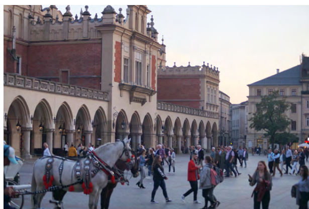
Sukiennice — od czasów średniowiecza pełniące niezmiennie funkcję handlową

i kultury. Jeszcze w XII wieku otwarto tu bibliotekę. Niedługo potem powstała szkoła katedralna uważana za najlepszą w tym czasie uczelnię w Polsce. Rozbudowa miasta wokół wzgórza Wawelskiego jeszcze bardziej podkreślała znaczenie zamku.