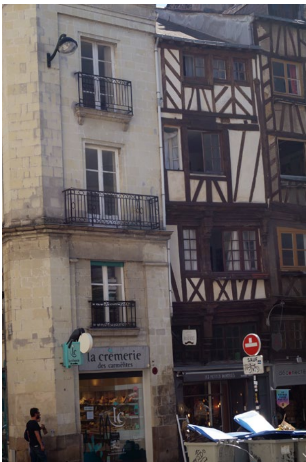
Fotografia 3. Dziś niektóre z domów przechylały się z powodu podmokłego i grząskiego terenu, na którym zostały wzniesione.

zostało w drugiej połowie XVI stulecia ogłoszone stolicą Bretanii. Mimo niekorzystnego biegu wydarzeń Nantes nadal bardzo prężnie rozwijało się gospodarczo i politycznie, będąc jednym z najważniejszych portów regionu leżących nad Atlantykiem.