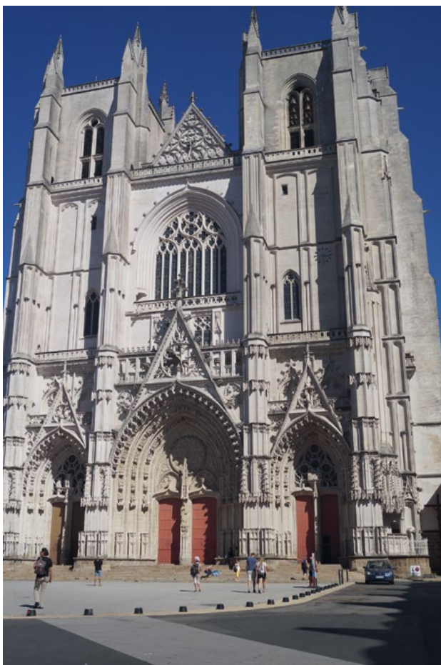
Fotografia 2. Budowę Katedry zaprojektowanej w stylu gotyckim rozpoczęto w roku 1434, a ukończono w... 1861.