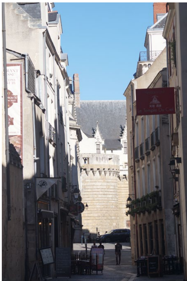
Fotografia 7. Pragnącym ciszy, polecałbym nocny spacer po opustoszałych uliczkach Starego Miasta.

szczególnie polecałbym znakomite przedstawienia przygotowane na scenie Angers-Nantes Opéra, a pozostałym — odwiedzić w klubie Pannonica, gdzie często występują wielkie gwiazdy jazzu i rocka. Pragnącym ciszy, doradzałbym nocny spacer po opustoszałych uliczkach Starego Miasta. Ich wieczorna atmosfera pozwala zapomnieć o kłopotach codzienności.