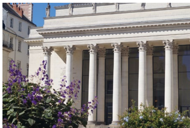
Fotografia 1. Piękno zabudowy, a także uroda bardzo licznych parków i skwerów powoduje, że Nantes często jest wybierane jako cel podróży.

Nazwa miasta wzięta się od galijskiego plemienia Namnetów, którzy w pobliżu dzisiejszego centrum założyli swoją osadę. Jednak prawdziwy rozwój zainicjowali dopiero Rzymianie, którzy przekształcili Nantes w bardzo ważny ośrodek handlowy. Szybko wzrastająca zamożność mieszkańców z powodzeniem zajmujących się szeroko zakrojoną wymianą towarową spowodowała że miasto stało się celem napaści Wikingów, których kusity dobra będące w posiadaniu coraz bogatszych mieszczan. Początkowo wysiłek zbrojny przyniósł napastnikom spore sukcesy pozwalające na okupację terenu samego Nantes i okolicznych osad, ale już w roku 937 musieli uznać wyższość odważnego potomka bretońskich wodzów — Alaina Krzywobrodego. Młody bohater po pokonaniu najeźdźców w nagrodę został władcą Bretanii i ustanowił Nantes stolicą swojego Księstwa. Niestety przez cały okres Średniowiecza miasto musiało konkurować o palmę pierwszeństwa z Rennes i choć zdawać się mogło, iż w ostatecznym rozrachunku wygra tę rywalizację, to właśnie Rennes