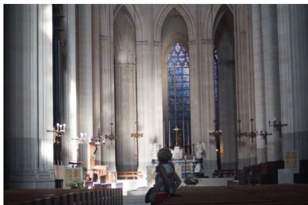
Fotografia 4. Podziw budzi również nieprawdopodobnie wysokie sklepienie nawy głównej Katedry...

Kontynuując spacer po mieście, trzeba koniecznie udać się do kwartału Île Feydeau zabudowanego XVIII-wiecznymi kamienicami w tym samym stylu i tej samej wysokości, co najbardziej rzuca się w oczy przy rue Kervégan, gdzie można podziwiać nie tylko budynki, ale również pięknie dekorowane balkony. Rezydencje te powstały w tym samym czasie na zlecenie armatorów wzbogaconych na morskim handlu, którzy wybrali sobie wyspę Feydau na swoista enklawę. Po wdrożeniu programu likwidacji dopływów Loary i l’Erdre wyspa stała się częścią stałego lądu. Dziś niektóre z domów przechylają się z powodu podmokłego i grząskiego terenu, na któ-