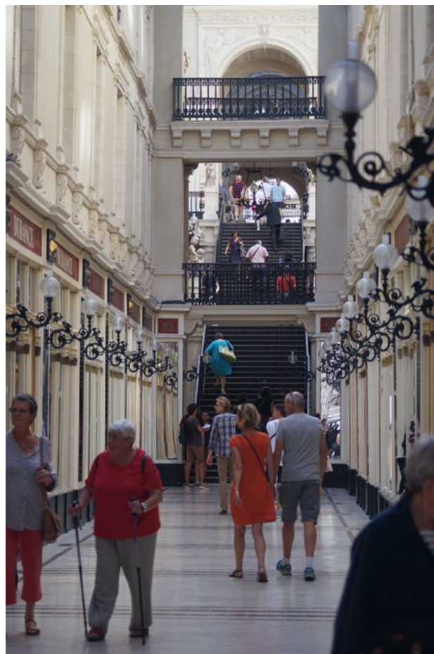
Fotografia 6. Pasaż Pommeraye’a imponuje oryginalną ornamentyką wewnątrz i niezwykle oryginalnymi rozwiązaniami architektonicznymi.

Po całym dniu zwiedzania warto znaleźć wytchnienie, ciesząc się pięknym muzyki. Miłośnikom opery