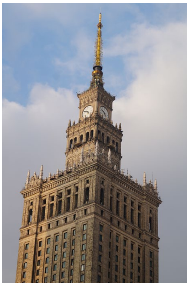
... a Warszawa w kwietniu

Logo „Valve for Life”, przygotowane przez polski zespół, uznano za najlepsze i stało się oficjalnym logiem inicjatywy w Europie i na świecie. Od tego czasu inne kraje Europy zaczęły wzorować się na polskich działaniach. Dzięki ścisłej współpracy z agencją ELEVEN ZETT Productions kampania „Stawka to życie. Zastawka to życie” została również partnerem imprez adresowanych do pacjentów między innymi 5. Ogólnopolskiego Marszu Nordic Walking „Przełoń zawał” oraz Mikołajkowego Dnia Zdrowia Seniora, który jest największym eventem edukacyjnym dla pacjentów, w tym seniorów, gromadzącym ponad 1000 osób. W ramach akcji przygotowano filmy edukacyjne dla pacjentów i lekarzy, budujące świadomość na temat zabiegów TAVI, pokazujące ścieżkę kwalifikacji i przygotowania do zabiegu, a także historię i zalety tej procedury dla pacjentów i lekarzy. Filmy udostępniono szpitalom, aby mogli z nich korzystać zarówno chorzy, jak i personel medyczny. Podczas tegorocznej edycji kampanii przeprowadzono również spotkania na Uniwersytetach Trzeciego Wieku, gdzie edukowano seniorów i przeprowadzano bezpłatne badania i konsultacje kardiologiczne (m.in. echo serca) dla uczestników. W 2017 r. kampania „Stawka to życie. Zastawka to życie” uzyskała patronat Ministerstwa Zdrowia