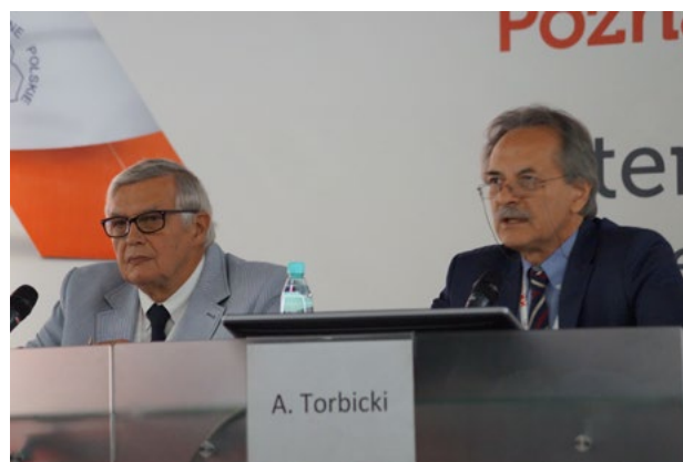
„Najbardziej Wpływowe Umysły Świata”

Zdaniem prezesa Polskiego Towarzystwa Kardiologicznego „obie kwestie pozostają poważnym wyzwaniem dla europejskich społeczeństw i systemów opieki zdrowotnej, stanowią także ogromne wyzwanie dla Polski, ale warto i trzeba wdrażać rozwiązania, które pozwolą skutecznie walczyć ze