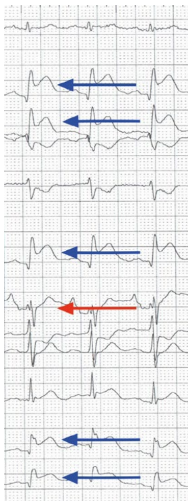
Rycina 2. Zapis EKG — niebieskie strzałki wskazują odprowadzenia II, III, aVF, V5, V6, czerwona strzałka odprowadzenie wewnątrzwieńcowe u 65-letniego pacjenta przyjętego w 3. godzinie STEMI ściany dolno-bocznej