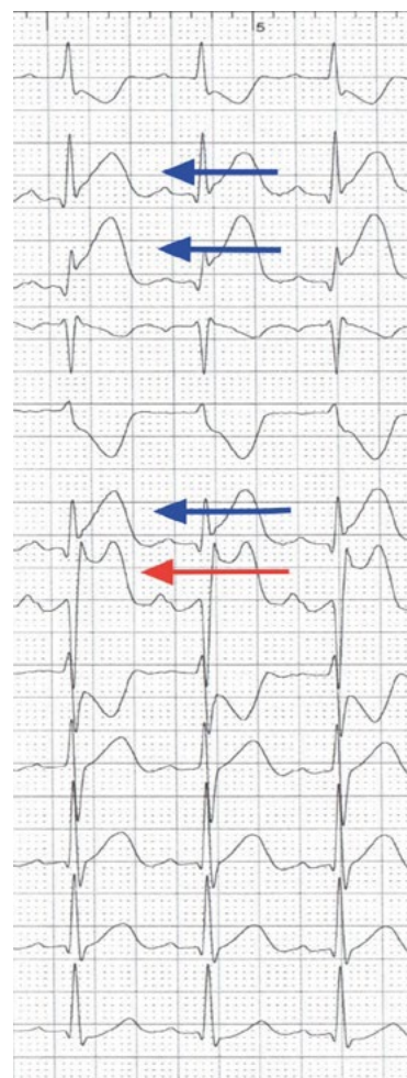
Rycina 3. Zapis EKG — niebieskie strzałki wskazują odprowadzenia II, III, aVF, czerwona strzałka odprowadzenie wewnątrzwieńcowe u 58-letniej chorej przyjętej w 4. godzinie STEMI ściany dolnej, u której przed diagnostyką inwazyjną wystąpiło VF. W odprowadzeniu IC wyraźnie widoczne siodełkowate uniesienie ST