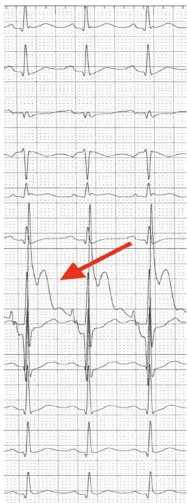
Rycina 1. Zapis EKG — czerwona strzałka wskazuje odprowadzenie wewnątrzwieńcowe (IC) u 51-letniego pacjenta przyjętego w 2. godzinie silnego stałego bólu stenokardialnego, w wykonanym badaniu koronarograficznym stwierdzono zamknięcie gałęzi okalającej lewej tętnicy wieńcowej. Zwraca uwagę brak uniesień w odprowadzeniach przekłatkowego EKG oraz dodatkowo wysoki woltaż załamka R w odprowadzeniu IC

Fala U reprezentuje ostatnią fazę repolaryzacji komór. Istnieje kilka ścierających się teorii na temat powstania fizjologicznej fali U. Przy prawidłowym stężeniu potasu w surowicy jest to małe ugięcie