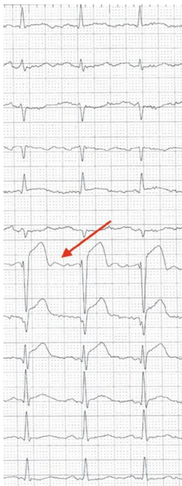
Rycina 5. Zapis IC-EKG zaznaczony czerwoną strzałką wskazującą na dodatnią falę U. Zapis wykonany w trakcie PCI LAD w okresie STEMI ściany przedniej

Wewnątrzściennowe EKG (IC-EKG) winno być postrzegane raczej jako uzupełnienie, a nie alternatywa dla powierzchniowego EKG. Obecnie dysponujemy przekonującymi dowodami na większą czułość w rozpoznawaniu niedokrwienia w zapisach IC-EKG w stosunku do przekłatkowego EKG zwłaszcza w dorzeczcu lewej tętnicy wieńcowej. Ze względu na prostotę zastosowania i niski koszt jest duża szansa na dalszy rozwój tej metody w dalszych zastosowaniach klinicznych.