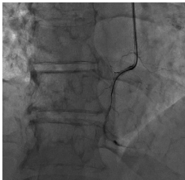
Rycina 3. Caravel podczas zabiegu udrożnienia prawej tętnicy wieńcowej. Zwraca uwagę niski profil końcówki mikrocewnika. Prowadnik Gaia 2

sprawiają, że jego użycie „robi różnicę” podczas większości zabiegów, a cena jest bardzo korzystna, dzięki czemu należy się spodziewać, że będzie stosunkowo często używany w polskich warunkach. Doświadczenia autora obejmują dwa przypadki zabiegów CTO, podczas których wszystkie zapewnienia producenta znalazły potwierdzenie, zarówno pod kątem manewrowalności, jak i ułatwionego przejścia przez zmiany miażdżycowe w związku z niskim profilem i niskim współczynnikiem tarcia. Reasumując, pół żartem, pół serio — nazwa została dobrana urządzeniu adekwatnie.