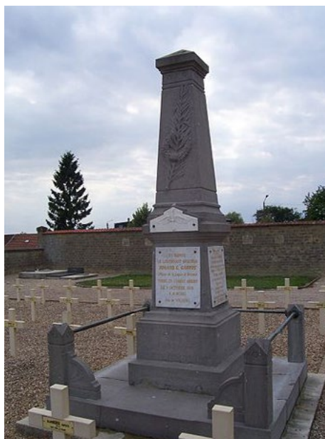
Rycina 2. Roland Garros poniósł śmierć w okolicach Vouziers w Ardenach i tam do dziś znajduje się jego grób

Warto wiedzieć, że najczęściej zwycięstw w paryskiej imprezie wśród mężczyzn odnieśli: Rafael Nadal (Hiszpania), który zwyciężał tu 9 razy (2005–2008, 2010–2014), Max Décugis (Francja), który wygrał turniej 8-krotnie (1903, 1904, 1907–1909, 1912–1914),