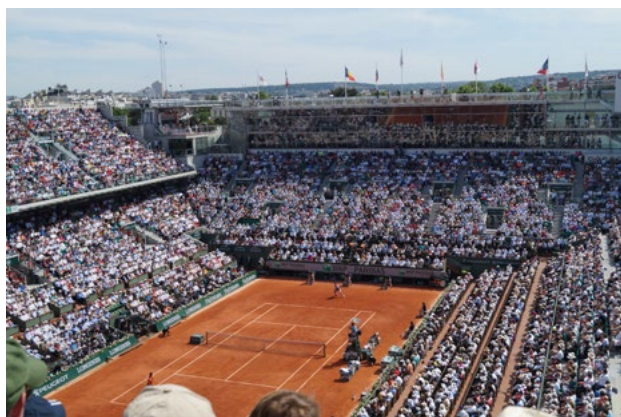
Rycina 1. Główną areną kompleksu jest Court Philippe Chatrier poświęcony znanemu francuskiemu dziennikarzowi

kolekcja dokumentów, plakatów, książek i czasopism, a także baza danych i statystyk meczów turnieju od 1928 roku. Centrum multimedialne zawiera około 4000 godzin cyfrowego wideo: filmy dokumentalne, wywiady z zawodnikami, filmy archiwalne. Wycieczki odbywają się dwa razy dziennie, o godzinie 11.00 i 15.00. Podczas zawodów opłaty wstępu nie obowiązują posiadaczy biletów na turniej.