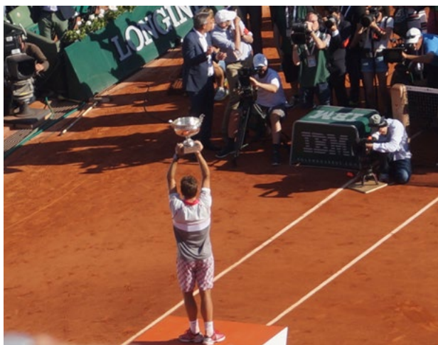
Rycina 4. Zwycięzcy turnieju otrzymują specjalny puchar nazywany Coupe des Mousquetaires, czyli Puchar Muszkietierów

Roland Garros to piękna i... bardzo atrakcyjna impreza. Przez wielu nazywana jest najpiękniejszą lewą Wielkiego Szlema. Nie ukrywam więc, że bardzo bym się cieszył, gdyby to krótkie wprowadzenie pomogło w podjęciu decyzji, by właśnie tam zaplanować swój wypoczynek po dyżurze... ■