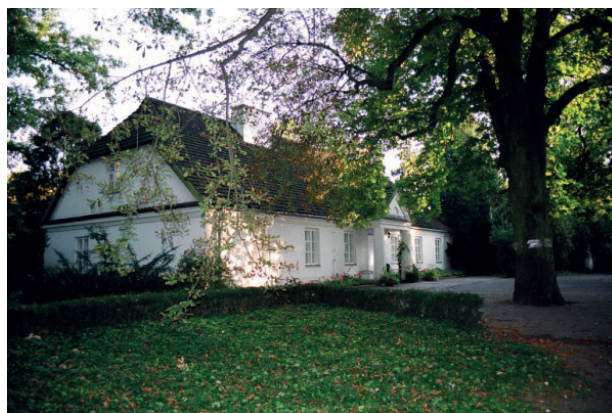
Fotografia 2. W domu Chopina w Żelazowej Woli obecnie stworzono klimat polskiego dworku pierwszych dekad XIX wieku