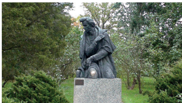
Fotografia 1. W 1969 roku w 120. rocznicę śmierci kompozytora odsłonięto pomnik z brązu autorstwa Józefa Gosławskiego

Woli, gdzie rodzina Chopinów przebywała na letnim wypoczynku. Był to ostatni pobyt kompozytora w miejscu swego urodzenia.