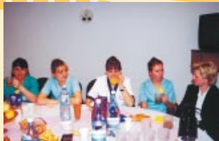
▲ ...dzięki czemu organizatorzy mieli chwilę na positek...