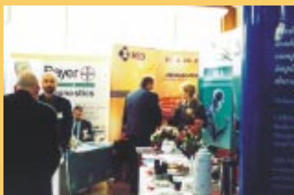
▲ ...nie zawiedli także sponsorzy