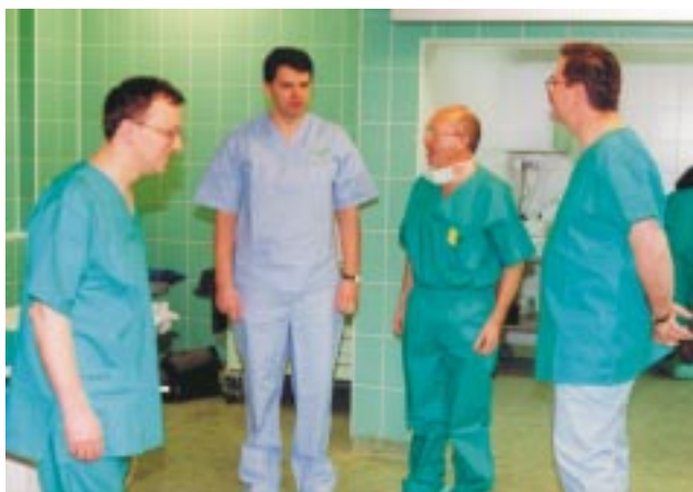
Pierwsza koronografia już za nami