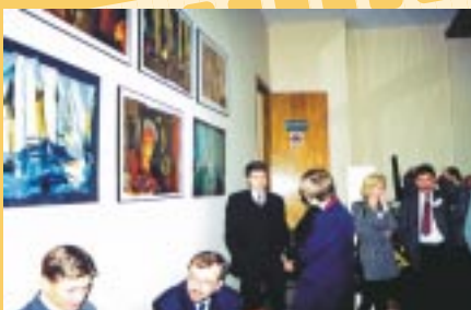
▲ a nasze oczy cieszyła wystawa obrazów