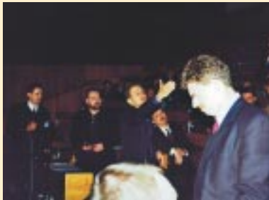
▲ Dyskusje na walnym zebraniu Sekcji rozgrzały nas do białości