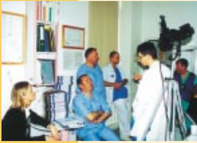
▲ Jak zwykle z obawą myśleliśmy o złośliwości rzeczy martwych