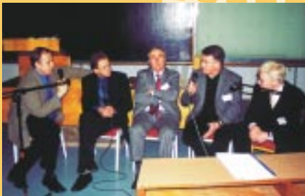
▲ ...i do Prezydium zaprosiliśmy sławnych gości