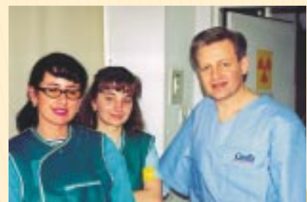
▲ Dlatego z radością oczekujemy kolejnych Warsztatów