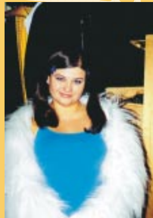
▲ I nie ostudziła nas nawet obecność gwiazd estrady