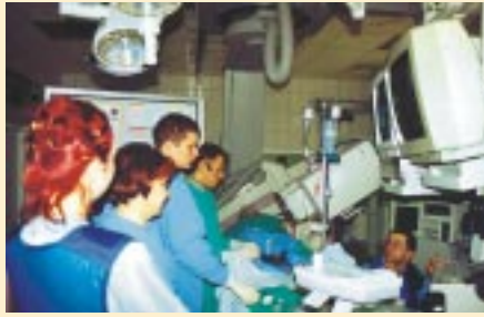
▲ ...ale upór i wiedza zwyciężyły