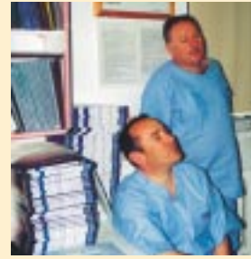
▲ W tym roku do cath-labu...