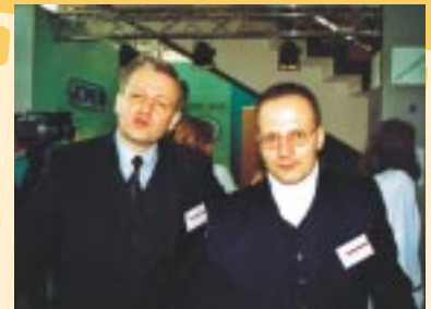
▲ ...i uśmiech do kamery