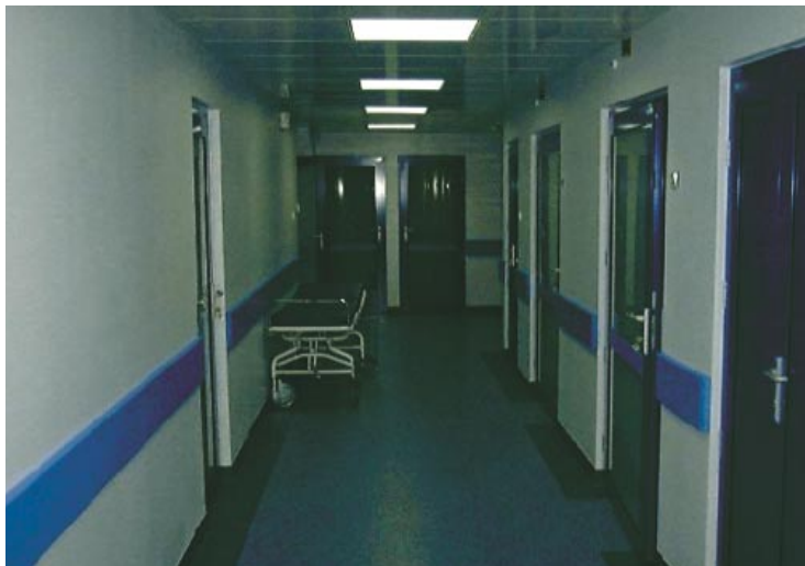
Projekt kliniki i wykonawstwo to dzieło fachowców z firmy Grupa 3J