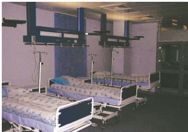
Sala intensywnego nadzoru kardiologicznego. Tak jak i reszta oddziału — w pełni klimatyzowana

Czy działanie ośrodka może się opłacić? Jest jeszcze za wcześnie, aby o tym mówić szczegółowo. Dzięki dużej liczbie zabiegów zakontraktowanych ze Śląską Kasą Chorych instytucja zachowuje płynność finansową, natomiast ostateczne rozliczenie roczne pokaże, czy przedsięwzięcie jest opłacalne.