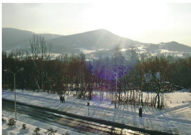
Widok z okien sali intensywnego nadzoru na stoki Małej Czantorii — chwila relaksu między zabiegami. A po pracy — zimą na narty, a latem kąpiel w Wiśle, rower górski lub towarzyski mecz tenisowy w miejscowym klubie

Serce kliniki — Pracownia Hemodynamiki wyposażona jest w angiograf Coroskop firmy Siemens. Ponadto pracownia dysponuje kontrapulsacją wewnątrzortalną oraz cyfrową archiwizacją danych. Wysokiej klasy aparat, zaawansowana technologia protekcji przed promieniowaniem oraz panele ze stali nierdzewnej na ścianach zyskały pełną aprobatę inspektorów ze Stacji Sanitarno-Epidemiologicznej