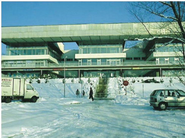
Zakład Przyrodo-Lecniczy Sanatorium Uzdrowskiego w Ustroniu. Tu mieści się nasza klinika