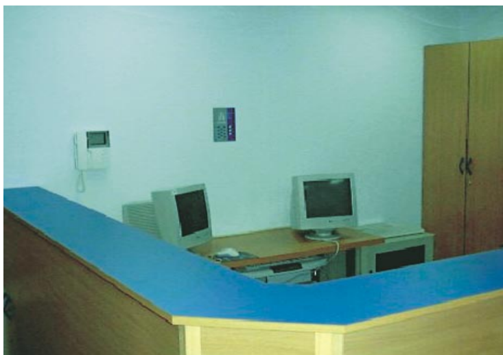
Recepcja — tu wprowadzane są do komputera wszystkie dane chorego przy przyjęciu. Pełna komputeryzacja pozwala na archiwizację danych klinicznych i administracyjnych, a także prowadzenie księgowości, rozliczeń finansowych oraz sprawozdań dla Kasy Chorych