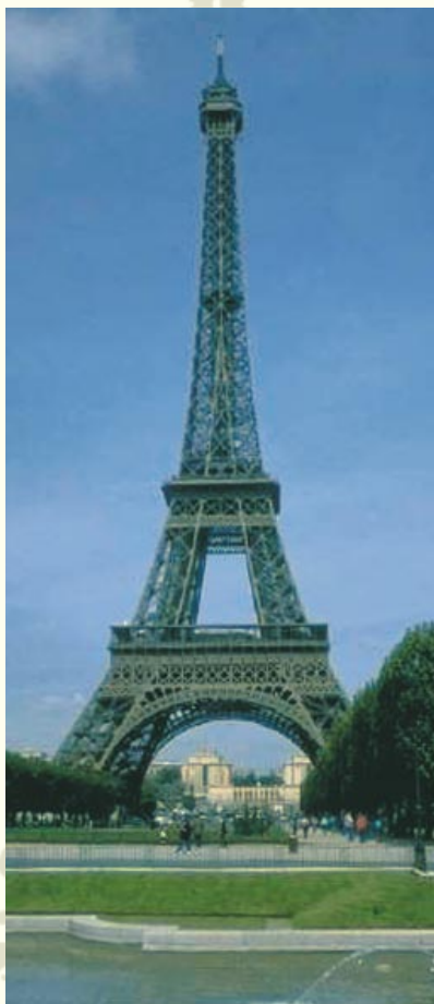
Paryż, maj 2001

rynku mamy ich coraz więcej: filtry (Angioguard, AccuNet, MedNova, TRAP, FilterWire, EPI FilterWire, Angio-Pro i in.) lub balony zatrzymujące wędrujący materiał zatorowy (PercuSurge-GuardWire, MO.MA). Po korzystnych wynikach badania SAFER (PCI graftów żylnych) urządzenie GuardWire™ PercuSurge uzyskało akceptację Federal Drug Administration . Ogólnie filtry są łatwiejsze w użyciu, nie wymagają odrębnej ewakuacji materiału zatorowego i nie blokują przepływu