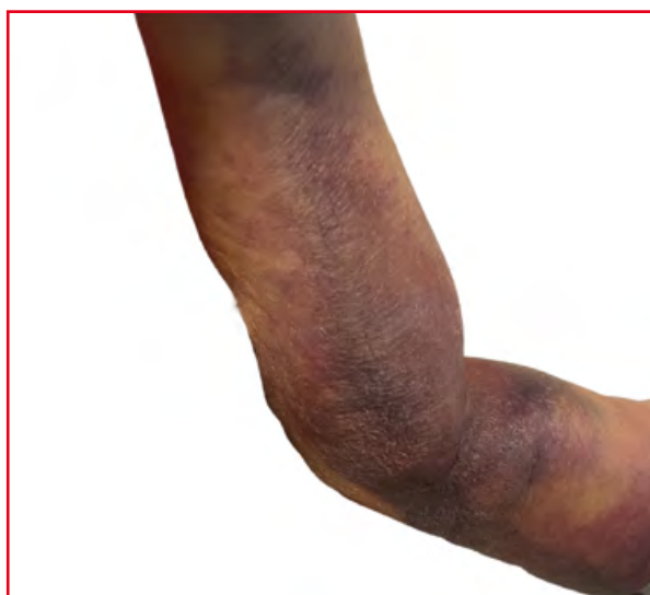
Rycina 2. Rozległa wybroczyna prawej kończyny górnej