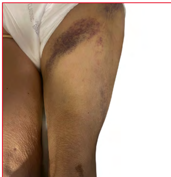
Rycina 3. Rozległa wybroczyna kończyny dolnej