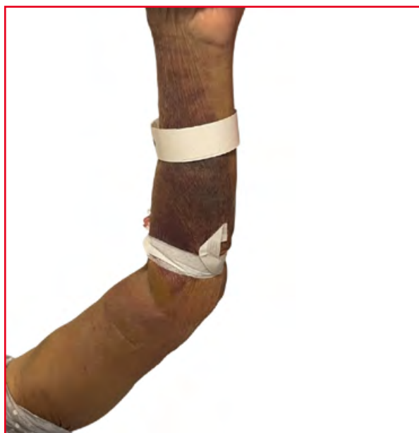
Rycina 1. Rozległa wybroczyna lewej kończyny górnej