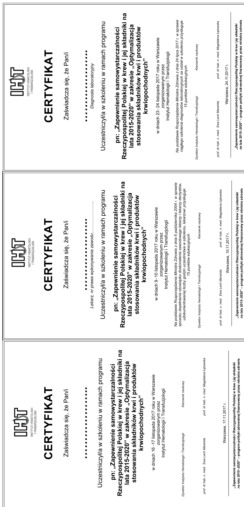
Rycina 1. Certyfikaty potwierdzające udział w szkoleniu zorganizowanym przez Instytut Hematologii i Transfuzjologii w listopadzie 2017 roku